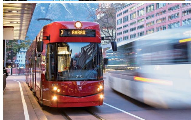
Stadt Linz, Stadt Innsbruck (2)