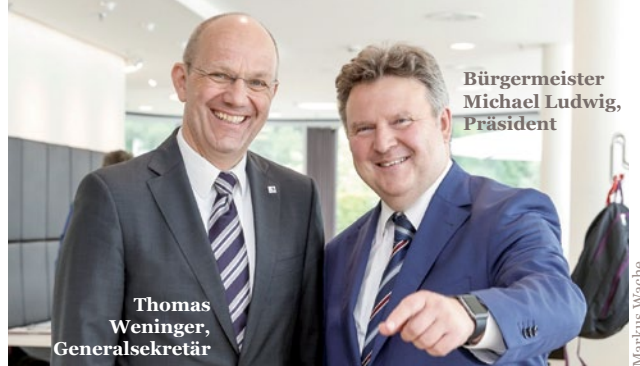
Bürgermeister Michael Ludwig, Präsident