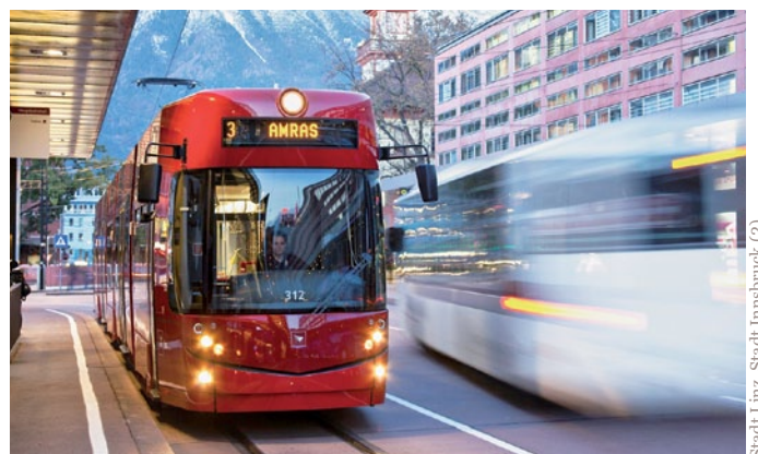
Stadt Linz, Stadt Innsbruck (2)