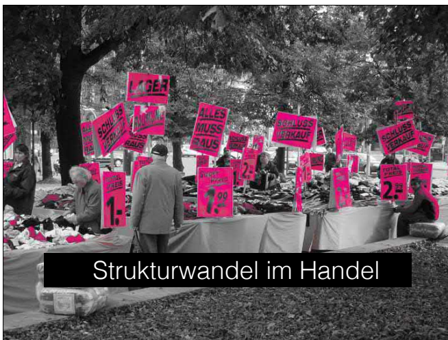
Strukturwandel im Handel