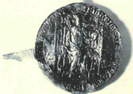
Älteste Urkunde von 1328