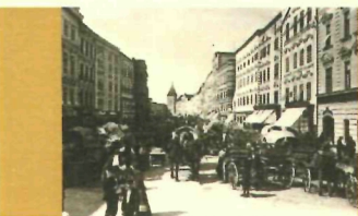
Stadtarchiv Wels Der Welser Stadtplatz Foto: um 1900