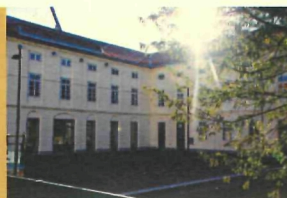
Stadtarchiv Wels Dreiklang-Herminenhof 4600 Wels Maria-Theresia-Straße 33