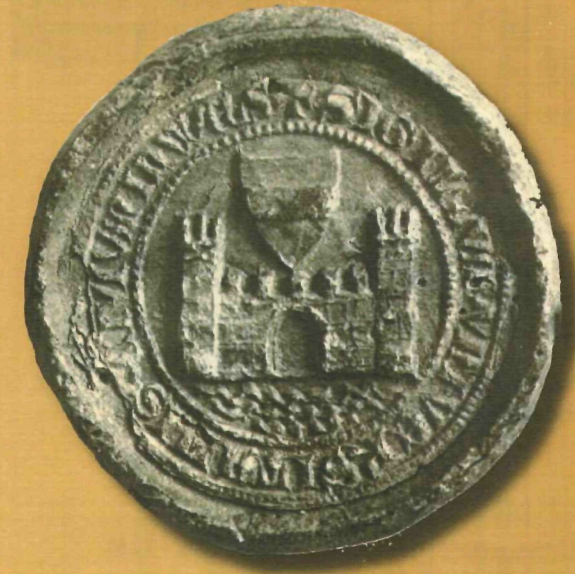
Siegel der Stadt Wels, 1427

Stadtarchiv Wels Dreiklang-Herminenhof 4600 Wels, Maria-Theresia-Straße 33