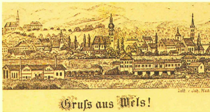
Ansichtskarte aus dem Jahre 1884

Impressum: Herausgeber: Stadt Wels, Dienststelle Stadtarchiv Herstellung: Eigenvervielfältigung