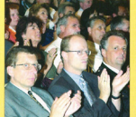
Rund 600 Mandatsträger aus ganz Österreich verlebten drei Tage über die Zukunft der Städte.

Viele der Mandatsträger aus ganz Österreich kommen öfter in unsere Stadt, einige eher seltener, doch in den jeweiligen Komitees zu Villach herrschen ein Grundton vor. Villach habe sich toll entwickelt, hier sei Aufschwung, eine Dynamik wie kaum in einer anderen Stadt spürbar!