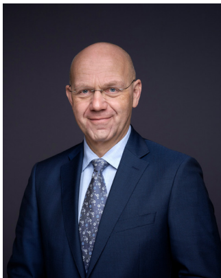
Michael LUDWIG Präsident des Österreichischen Städtebundes