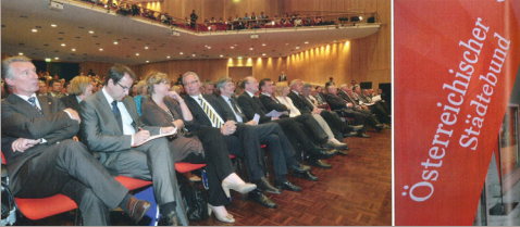
Rund 800 Bürgermeister und Gemeinderäte aus ganz Österreich beherbergten drei Tage lang in Congress Center über die Zukunft der Städte.

resolution Der Österreichische Städtebund der 288 Städte und Gemeinden vertritt, hat eine Resolution an die Bundesregierung formuliert, die bereits von 80 Städten – darunter auch unsere Stadt – und Gemeinden großteils unterstützt, von einem Fiskus im Gemeindefiskalbereich wurde. Demnach soll eine grundlegende Strukturformel die Aufgaben der Städte und Gemeinden neu, regeln. Doppelgleisigkeiten und intransparente Kooperationsformen zwischen Bund, Ländern und Gemeinden sollen gestrichelt werden, stattdessen klare Aufgabenstellungen und volle Mitpraxis etabliert werden („wer zahlt, schafft art“). Die schwebende finanzielle Ausübung durch den Bund muss getrennt und ein „Städtepaket“ (analog zum Bankpaket der Bundesregierung) im Umfang von 1,8 Milliarden Euro als Überbrückungshilfe zur Verfügung gestellt werden.