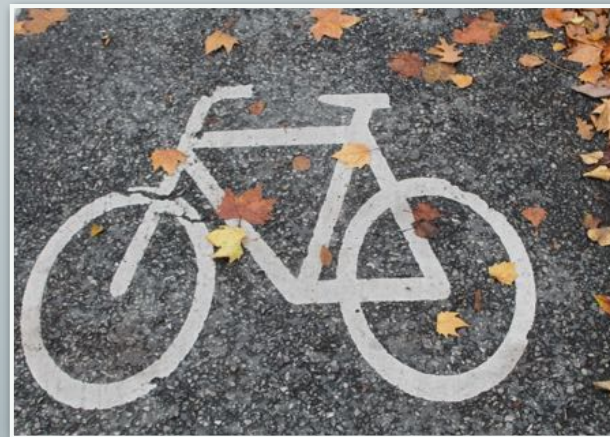
Sicheres Radfahren, Villach und Wörgl